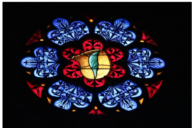
Dans la chapelle Erlach-Ligerz un écu aux armes du saint patron de la Collégiale : Saint Vincent