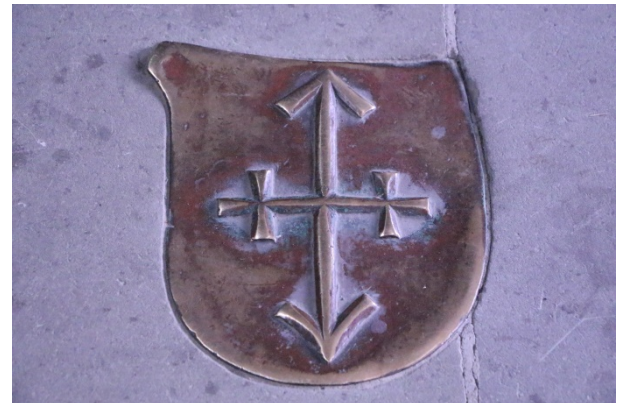
Plaque d'armoiries en bronze aux armes de la famille Tillmann