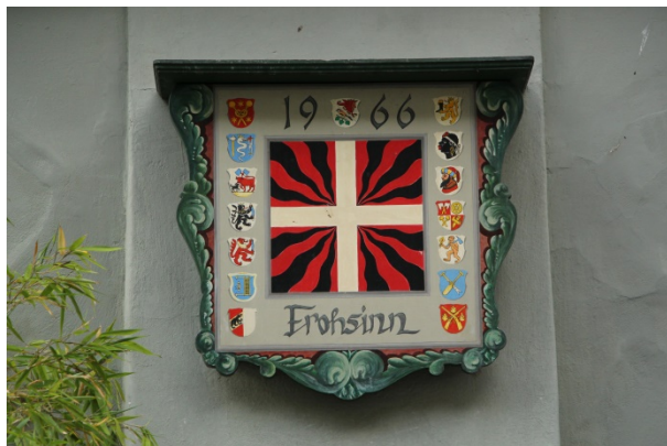
La façade du restaurant Frohsinn présente le drapeau militaire bernois de l'Ancien Régime accompagné des armoiries des corporations.