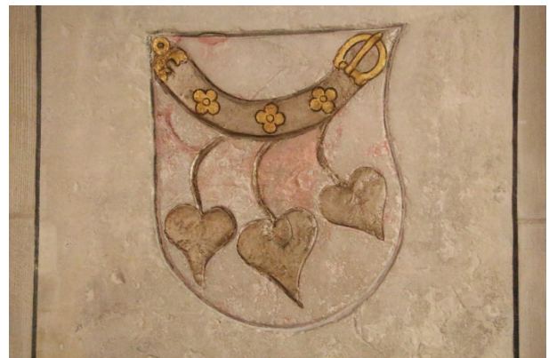
Pierre tombale aux armes de la famille Stein.