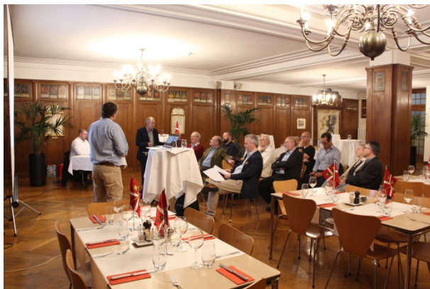
La réunion dans la salle de la Zunftsaaal