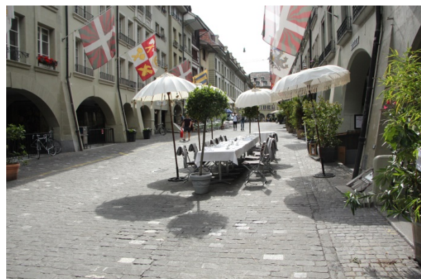
La vieille ville de Berne est décorée des drapeaux des corporations.