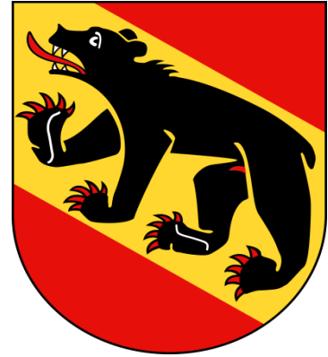
Armoiries de la ville et du canton de Berne : De gueules à la bande d'or chargée d'un ours passant de sable armé, lampassé et viléné de gueules.