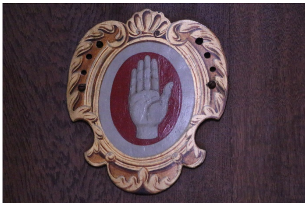
Plaque peintes aux armoiries de la famille Sinner.