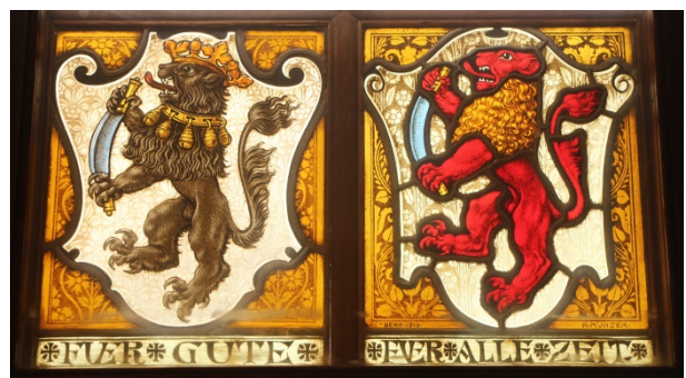
Vitraux héraldiques de la corporation des Ober-Gernern et de celle des Mittellöwen.