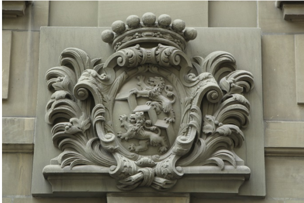
Les armoiries de la famille von Diesbach sur une porte dans la Kreuzgasse.