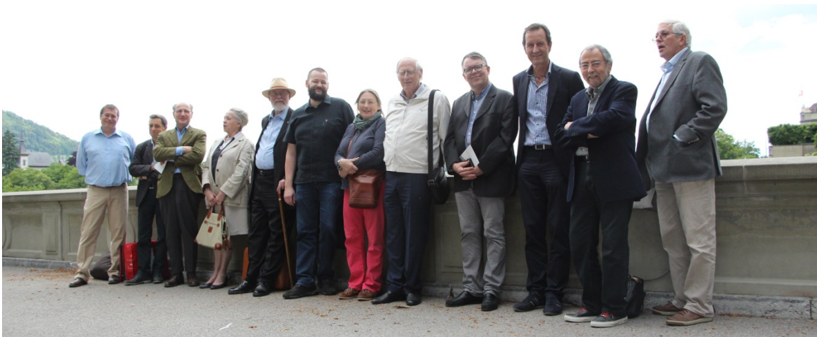
Les participants à la visite guidée de la Collégiale sur la Münsterplatte