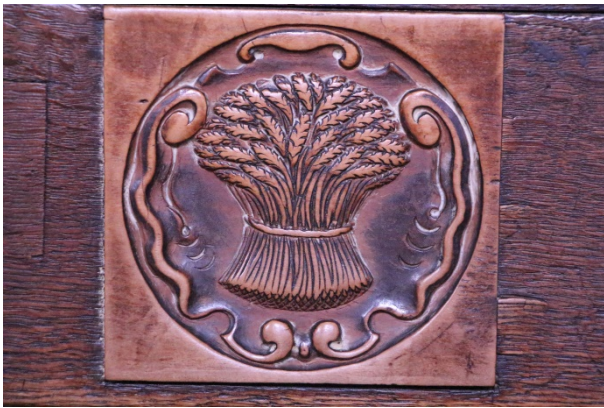
Sculpture sur le banc de l'église aux armes de la famille Zebender.