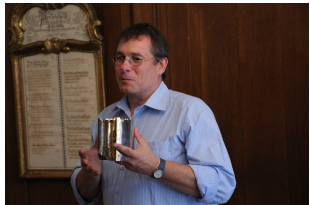
Le président présente le beaume cérémoniel pour le toast d'honneur.